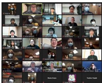
令和2年度の報告会の様子