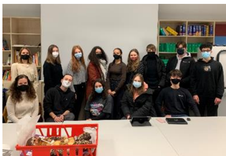
昨年度のグリーンクラブの参加者