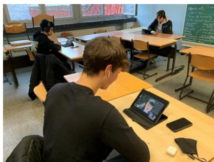
ドイツのオンライン交流の様子