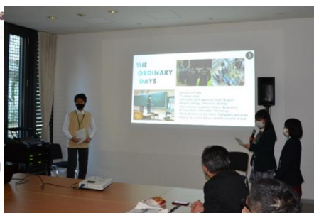
駐日ドイツ大使館訪問と活動報告