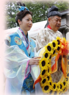
うねめ供養祭の様子

しかし、既に愛しい許婚も家族も亡くなっており、春姫は生きる望みの全てを失い、許婚の入水した山の井の清水に身を投げたと伝えられています。