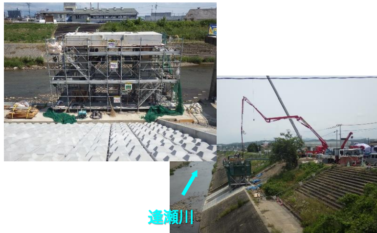
樋門コンクリート打設状況