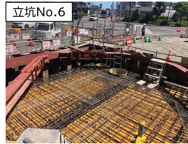
立坑No.6特殊人孔配筋・型枠組立