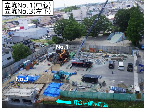
仮設土留設置等状況(池田公園内)

6月は、立坑No.1、立坑No.6の特殊人孔築造等を行いました。 7月は、引き続き、立坑No.1、立坑No.6の特殊人孔築造等を行います。