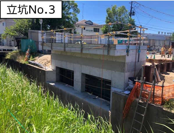
分水人孔躯体完成