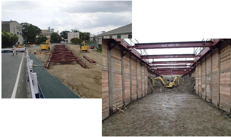
山留設置及び掘削状況（放流渠部）

7月は、高水護岸工・樋門築造・放流渠築造などを行いました。 8月は、引き続き樋門築造・放流渠築造などを行います。