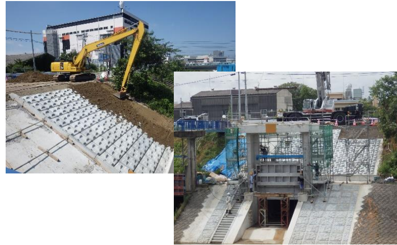
護岸工・樋門築造施工状況