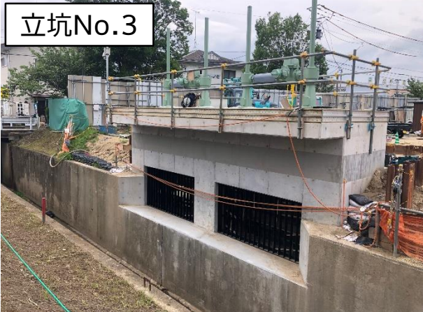
分水人孔ゲート設置完成