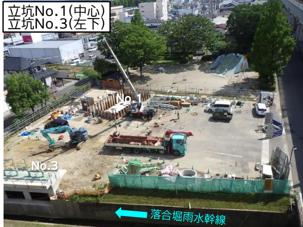
仮設土留設置等状況(池田公園内)

7月は、立坑No.1、立坑No.3、立坑No.6の特殊人孔築造等を行いました。 8月は、立坑No.2の特殊人孔築造等を行います。