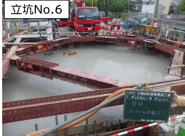
立坑NO.6特殊人孔コンクリート打設完了