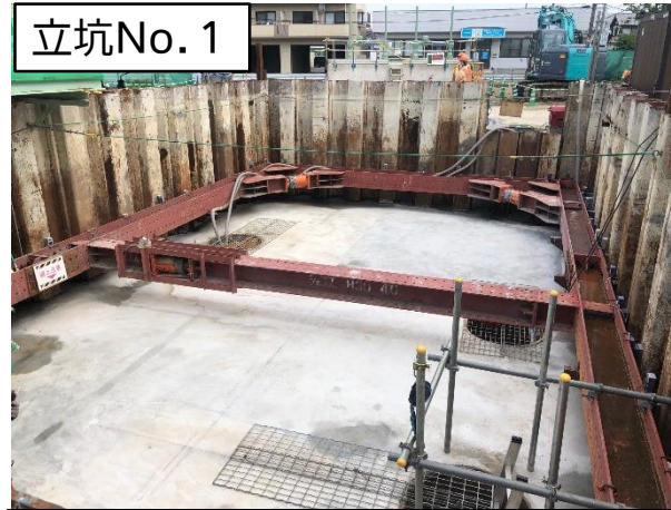
立坑No.1特殊人孔完成