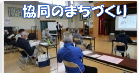
協同のまちづくり