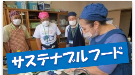
サステナブルフード

今後、こはらだ学級では「パティシエから学ぶ洋菓子」男塾では「パステル画」など様々な体験活動を開催します。 また合同で「カーボンニュートラル」や「巻紙語り」などを予定しています。