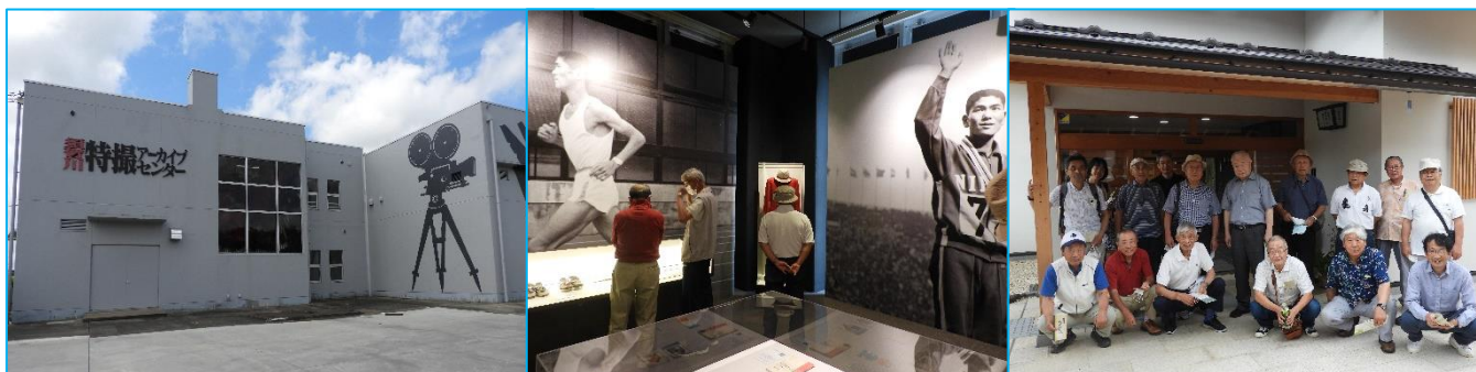
須賀川特撮アーカイブセンター