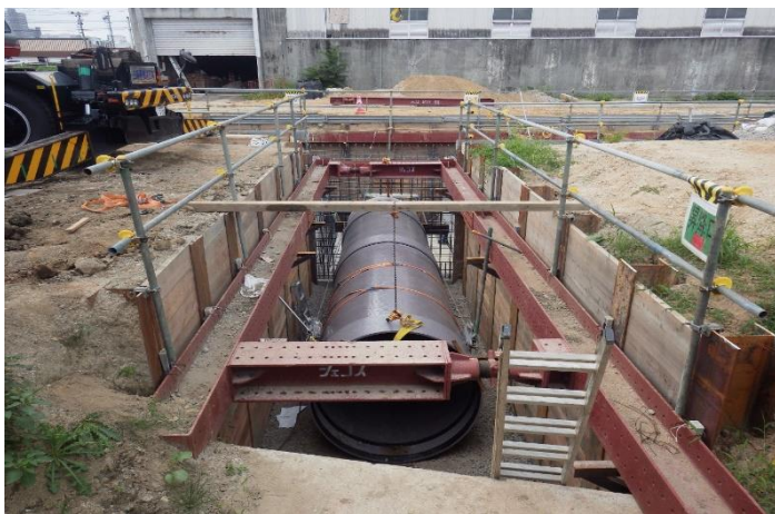
仮排水管設置状況