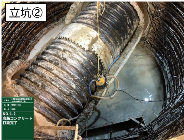
底板コンクリート打設完了