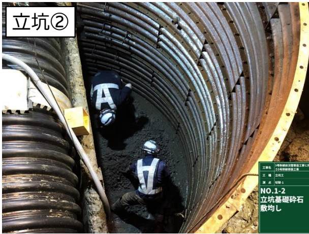
基礎碎石敷均し状況

8月は、立坑①～②間の鋼矢板及び立坑②のライナープレート設置と特殊マンホールの施工を行いました。 9月は、立坑①～②間の鋼矢板及び掘削と、立坑①のライナープレート設置を行います。