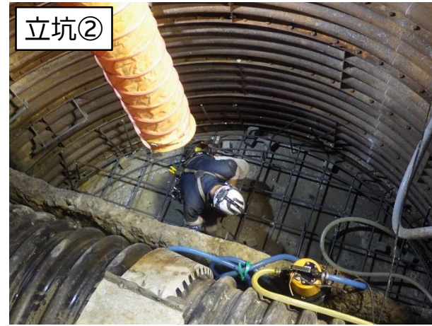
底板鉄筋組立状況