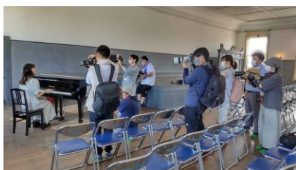
〈展示イメージと活動の様子〉