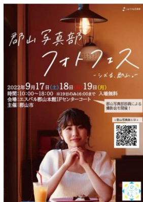
フォトフェス告知ポスター