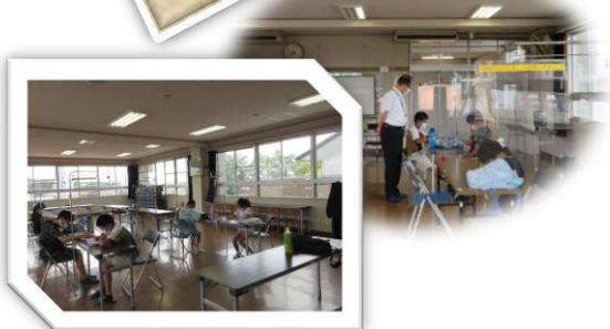
『夏休み宿題サポート』（青少年対象）