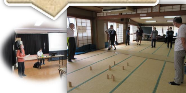
『男の休日クラブ』（男性対象）