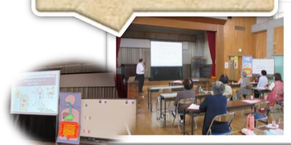
『きらめき学級』（女性対象）