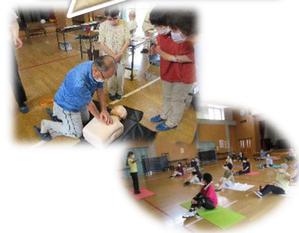
『さわやか学級』（高齢者対象）