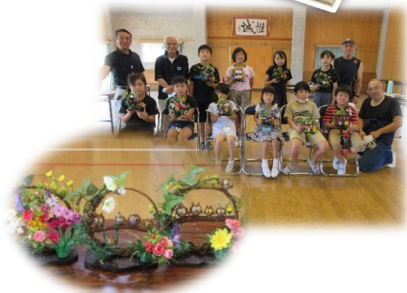
『こども工作教室』（青少年対象）