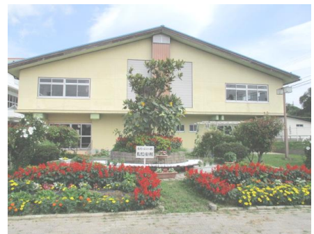
【小泉小学校の花壇づくり】