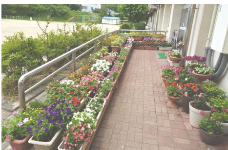
【行徳小学校の花壇づくり】