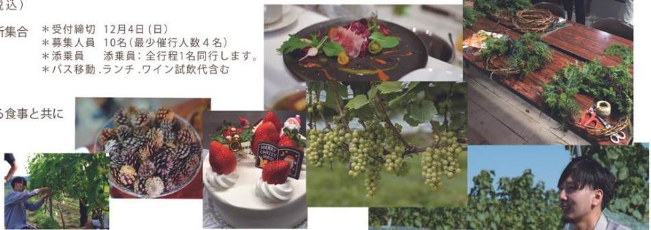
ランチ写真はイメージです。葡萄収穫後の葡萄つるの剪定となります。