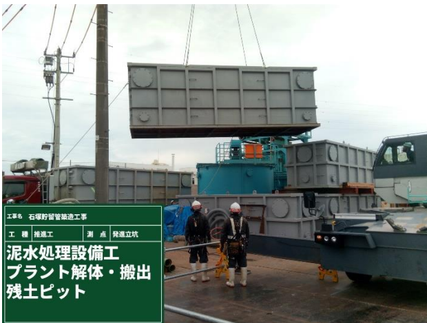
推進工地上設備撤去状況（推進工）