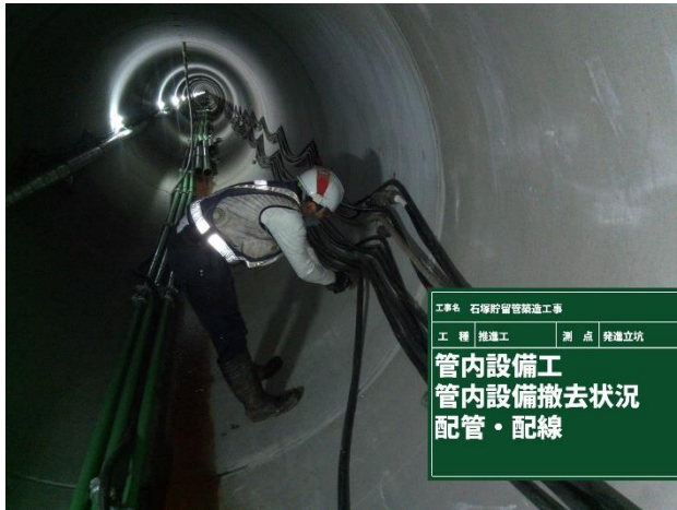
管内設備撤去状況（推進工）

10月は、推進工設備の撤去作業を行いました。 11月は、掘進機撤去に向け、到達立坑での作業を行います。