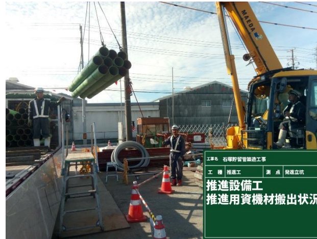
管内設備撤去状況（推進工）