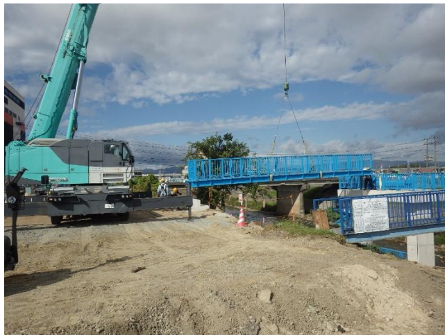
新設管理橋据付状況

10月は、放流渠及び中継柵の埋戻しと、管理橋の設置などを行いました。 11月は、既設樋門撤去のための仮栈橋設置等を行います。