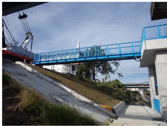
新設管理橋設置完了