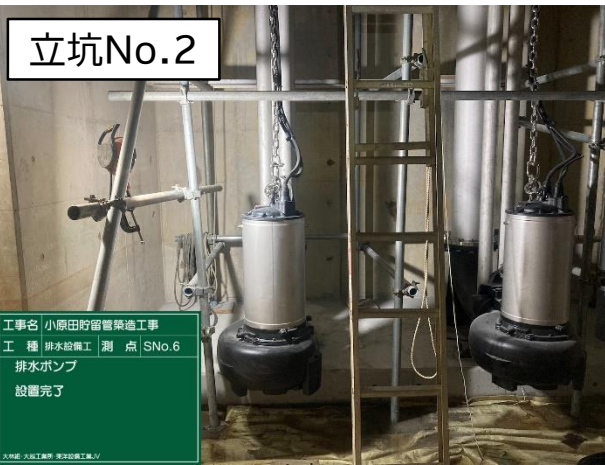
排水ポンプ設置完成