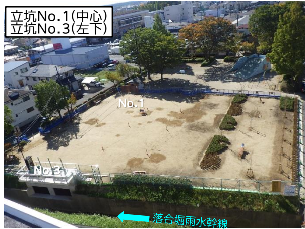
池田公園内復旧完了

10月は、立坑No.2の排水ポンプ設置等を行いました。 11月は、排水ポンプ付属設備設置等を行います。