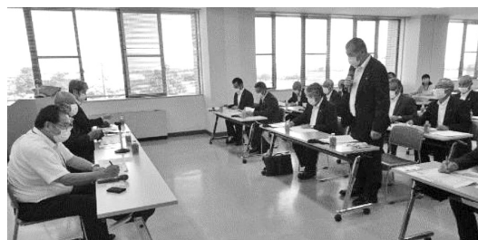
新潟市役所での研修