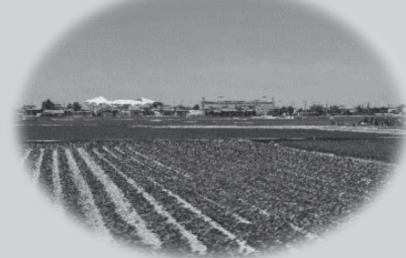
(新潟市の田園風景)