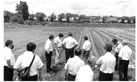
ほ場(エゴマ)見学を行いました