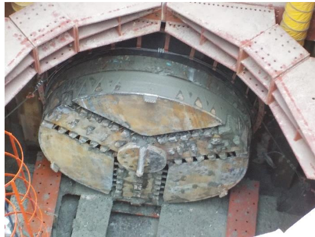
掘進機回収状況 (地下部)