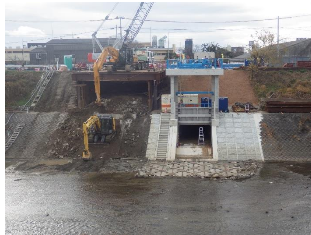
既設樋門撤去状況