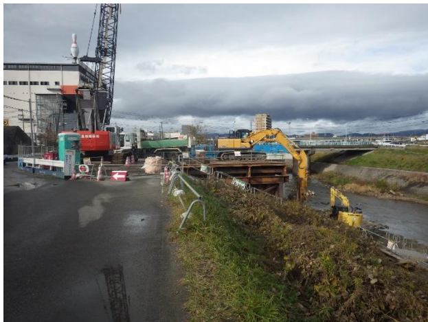
既設樋門撤去状況