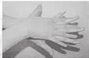
2. 手の甲を伸ばすように洗う