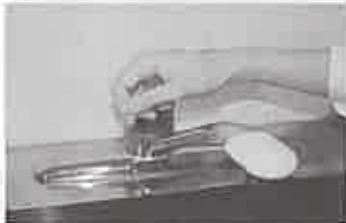
7. 水道の栓を止めるときは、手首が肘で止める。できないときは、ペーパータオルを使用して止める