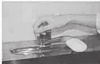
7. 水道の栓を止めるときは、手首が肘で止める。できないときは、ペーパータオルを使用して止める