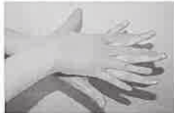
2. 手の甲を伸ばすように洗う