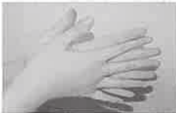
1. 手のひらを含ませ、よく洗う