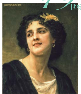
1.ルーカス・クラナハ(子)《聖母子》 2.ティントレット《ウリヤの死を知らされるダヴィデ王》1552年 3.レンブラント・ファン・レイン《髻襟をかけた女性の肖像》1644年 4.アンローバレ・カラッチ《聖母子》1587年 5.グイド・レニ《聖家族—エジプトへの逃避途上の休息》1637年 6.ジャン＝マルク・ナティエ《花の神フロラに扮する女性の肖像》1753年 7.フランシスコ・コセ・デ・ゴヤ・イ・シルシエンテス《水を運ぶ女性》 8.ウィリアム＝アドルフ・ブーグロー《美しいブルネットの女性の肖像》1898年