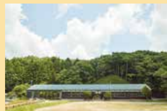
※写真はイメージです 森の駅yodge