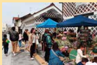
※写真はイメージです rojima フリーマーケット