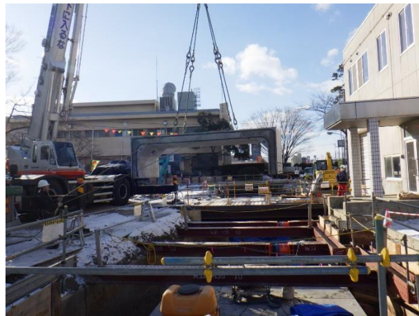
ボックスカルバート設置状況