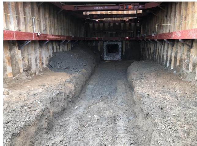
既設樋門撤去完了