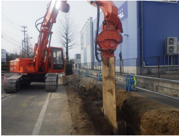
親杭横矢板設置状況

1月は、仮設土留工（親杭（H鋼）、横矢板設置）、覆工板設置を行いました。 2月は、ボックスカルバートの設置などを行います。