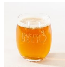
【オリジナルグラス】

クラフトビールをより楽しんでいただくため、デザインロゴを彫刻したオリジナルグラスを製作しました。ステップ・エンジニアリング社が自社で設計・製作した治具を用いることで、様々な形状の加工に対応できます。