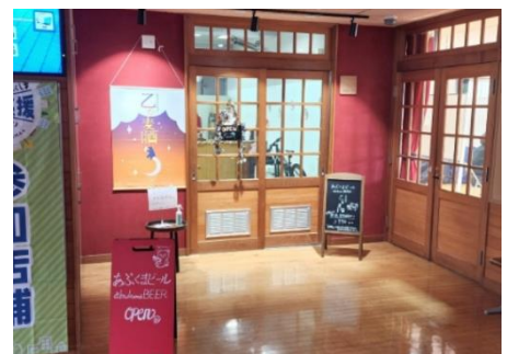
【あぶくまビール直売所】