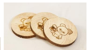
【オリジナルコースター】

あぶくまビールのキャラクターである「ホップくん」を配置したオリジナルコースターを製作しました。コースターの素材は、福島県郡山地区木材木工工業団地協同組合の協力により、福島県産ヒノキの端材を活用しています。温かみのある香りとシンプルなデザインで、様々なシーンにご利用いただけます。