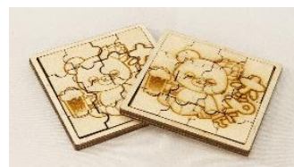
【オリジナルパズル】

子どもから大人まで幅広い年齢層が楽しめるようホップくんポップなフォントをデザインしたオリジナルパズルを製作しました。