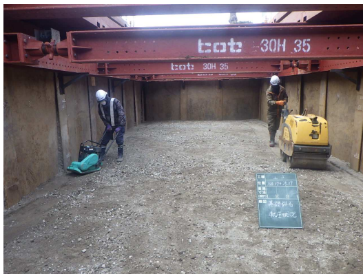
碎石基礎転圧状況