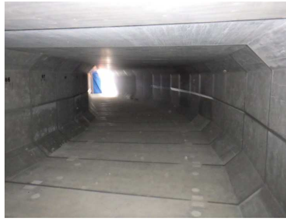
ボックスカルバート内部状況