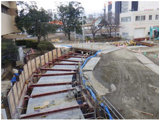
ボックスカルバート設置状況

2月は、ボックスカルバートの設置を行いました。 3月は、接続柵の築造を行います。