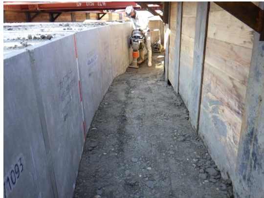
ボックスカルバート埋戻し、転圧状況