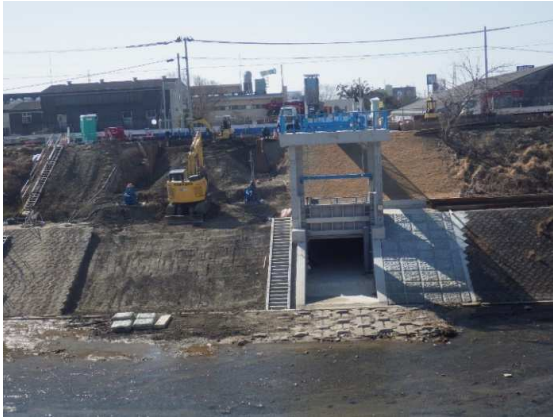
既設樋門撤去部埋戻し状況

2月は、既設樋門撤去部の埋戻し、仮栈橋撤去などを行いました。 3月は、引き続き、既設樋門撤去部の埋戻し及び護岸の復旧を行います。