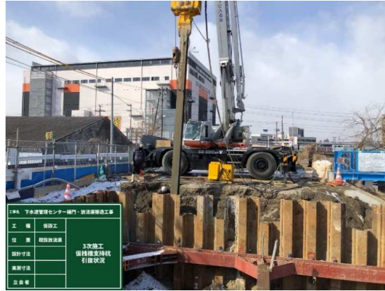
既設樋門部仮栈橋撤去状況