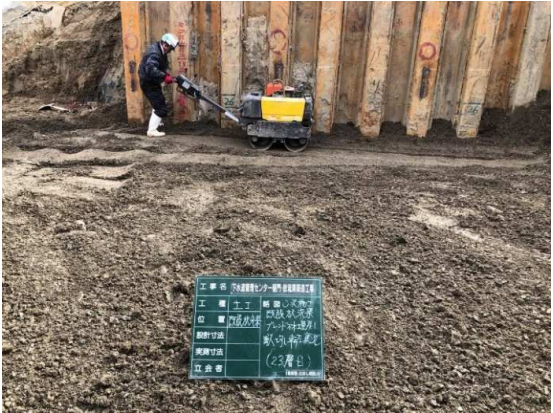
既設樋門撤去部転圧状況