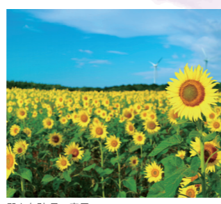
郡山布引 風の高原

休日に癒される、リフレッシュできる、「温泉」「アウトドア」「観光・フォトスポット」「子ども遊び場」のおすすめスポットを掲載！さらには、1年間の主なイベント情報も掲載しているので、移住を考えている方は癒しスポットとイベントを見て、こおりやま広域圏内の生活をイメージしてみてください！