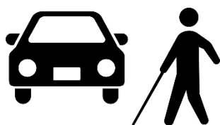
外出時の見守り活動