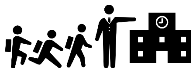
子どもの見守り活動

※参加登録事業所の活動事例について詳しくは、市ウェブサイト（QRコード：裏面）をご覧ください。