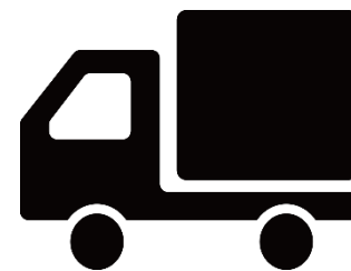
運転前のチェックリストに よる体調確認