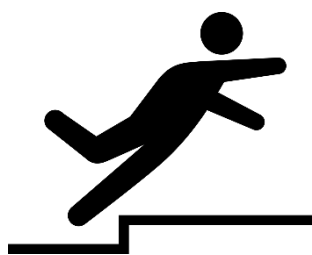
転倒予防に向けた 段差の解消