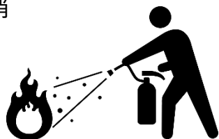
地域の防災訓練への参加