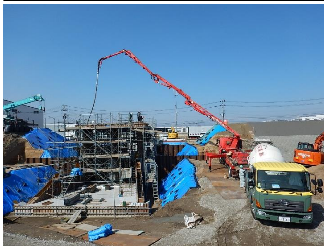
樋門コンクリート打設状況