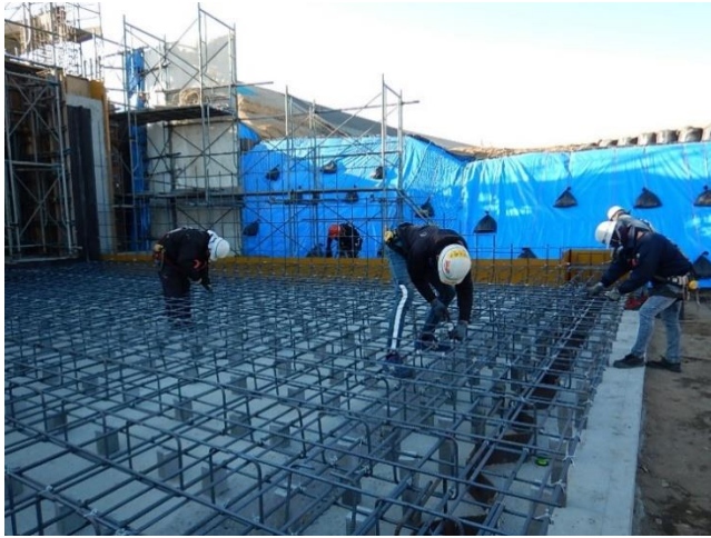
樋門鉄筋組立状況

3月は、樋門築造（鉄筋組立、コンクリート打設など）を行いました。 4月は、引き続き、樋門築造を行います。