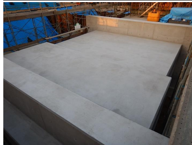
樋門コンクリート打設完了