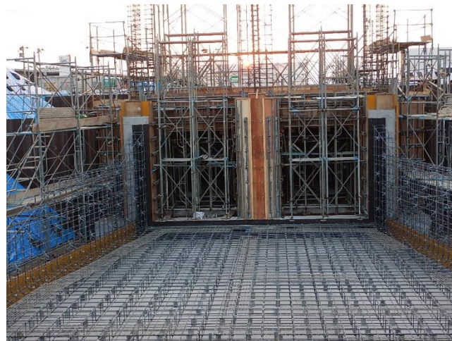
樋門鉄筋組立完了