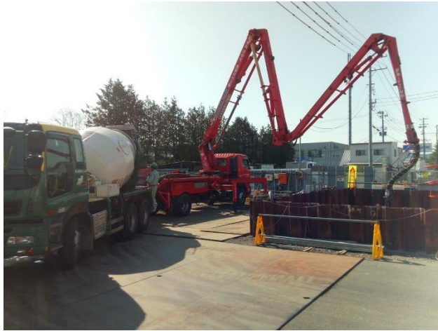
特殊人孔No.1コンクリート打設状況

3月は、発進立坑・到達立坑の特殊人孔、取付人孔の築造を行いました。 4月は、引き続き発進立坑・到達立坑の特殊人孔の築造などを行います。