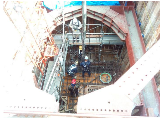
特殊人孔No.2コンクリート打設状況