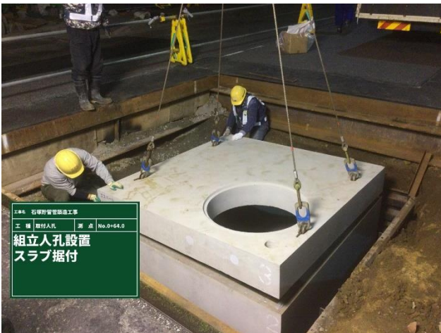
取付人孔据付状況