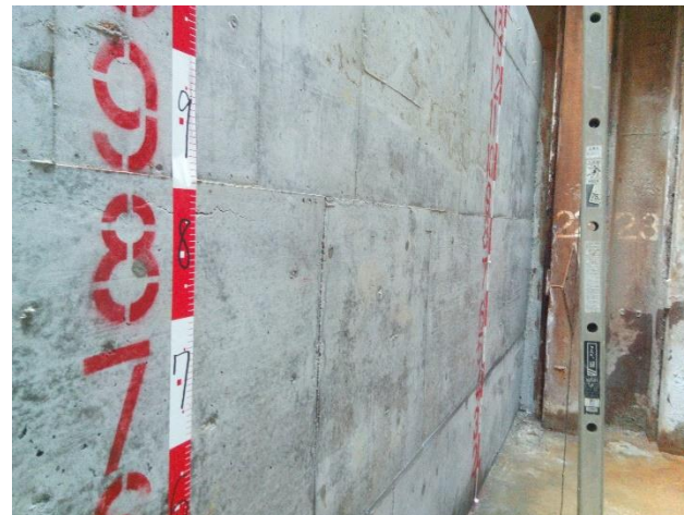
特殊人孔No.1側壁部完了