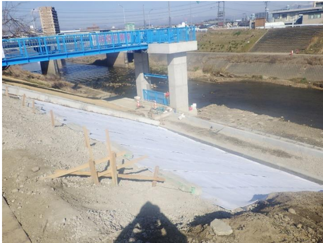
遮水シート設置状況

3月は、既設樋管撤去部の埋戻及び護岸復旧を行いました。 4月は、川裏の既設放流渠の撤去を行います。