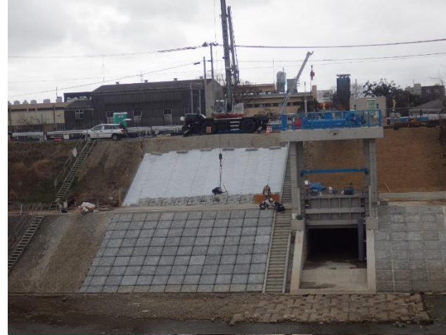
護岸ブロック設置状況