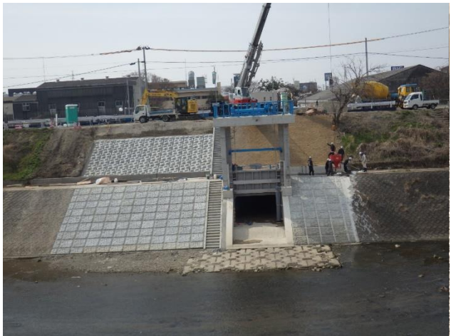
護岸ブロック設置完了