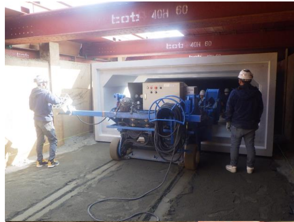
ボックスカルバート設置状況