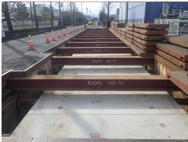
ボックスカルバート設置完了