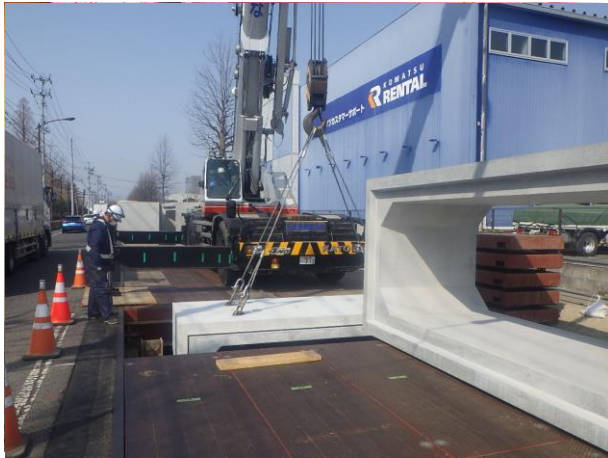
ボックスカルバート設置状況

3月は、ボックスカルバートの設置などを行いました。 4月は、引き続き、埋戻し及び植栽の復旧などを行います。