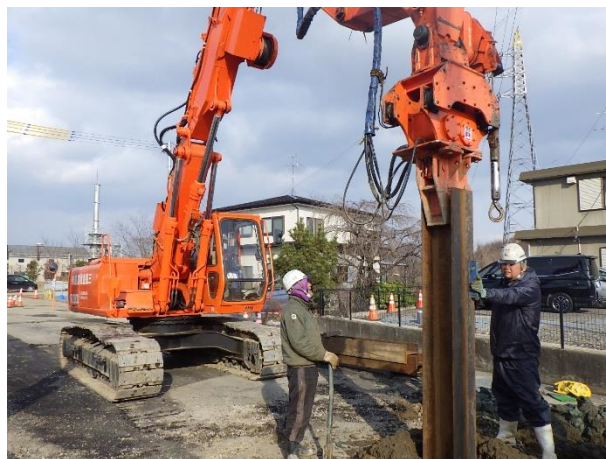
土留工（親杭）設置状況