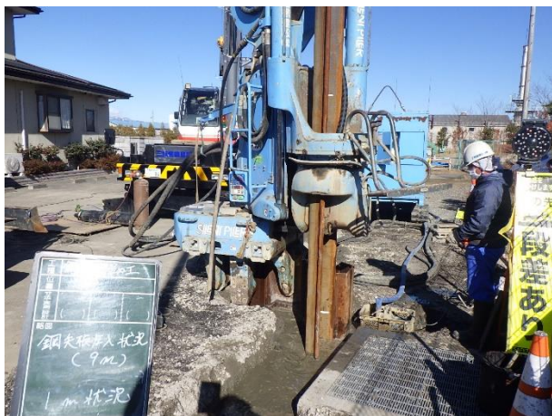
土留工（鋼矢板）設置状況

2月は、土留工、薬液注入工などを行いました。 3月は、引き続き、土留工、特殊人孔設置などを行います。