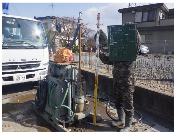
薬液注入工削孔状況