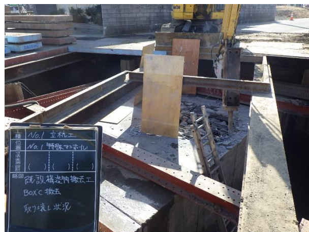
既設構造物撤去状況