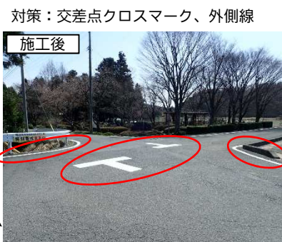
対策：交差点クロスマーク、外側線