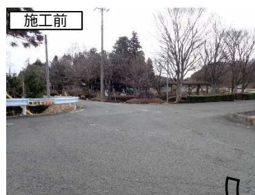
(場所) 逢瀬町多田野字清水池