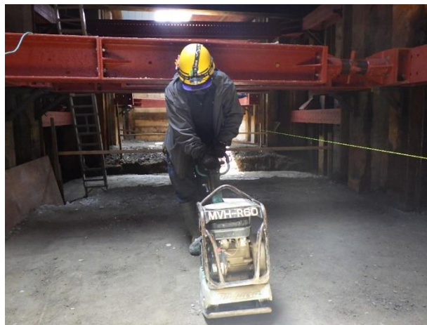
基礎砕石施工状況