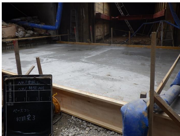
基礎コンクリート打設状況