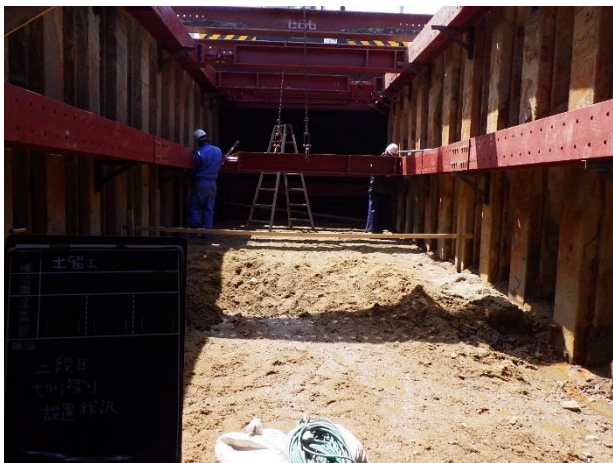
土留工（切梁）設置状況