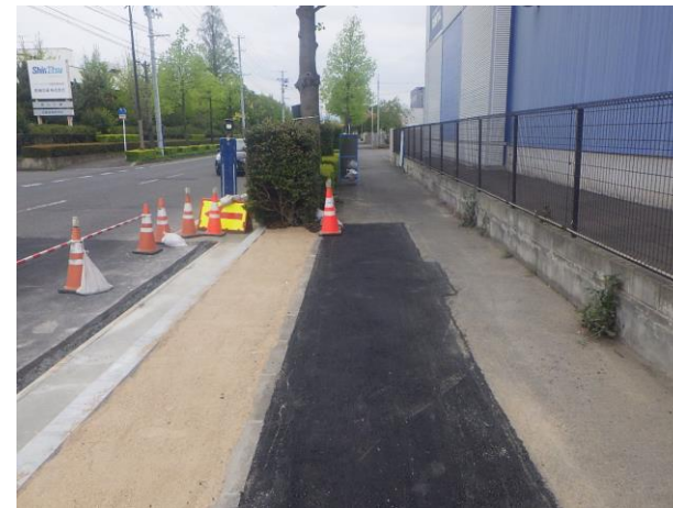
歩道部舗装復旧完了