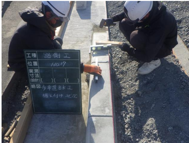
歩車道境界ブロック設置状況

4月は、歩車道境界ブロック、植栽、舗装などの復旧を行いました。 5月は、引き続き、歩車道境界ブロック、植栽、舗装復旧などを行います。