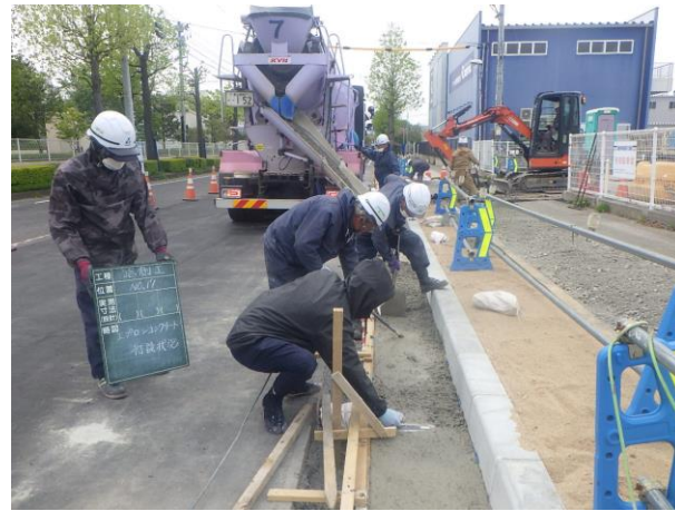
L型街渠コンクリート打設状況