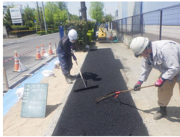
歩道部舗装復旧状況