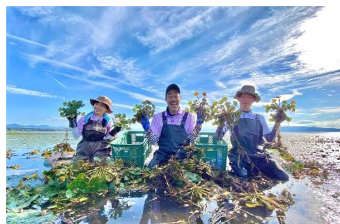
▲菱の実収穫体験の様子