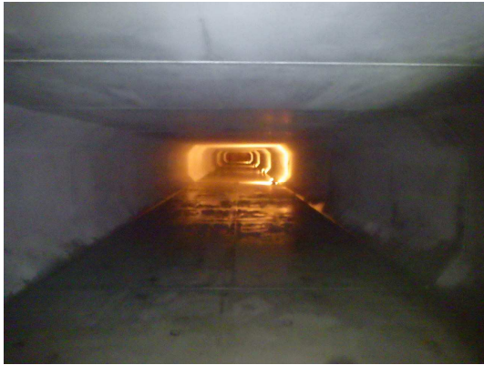
ボックスカルバート内部状況

5月は、歩車道境界ブロック、植栽、区画線などの復旧を行い、133号雨水幹線公共下水道築造工事（第9工区）が完了しました。本工事へのご理解とご協力ありがとうございました。