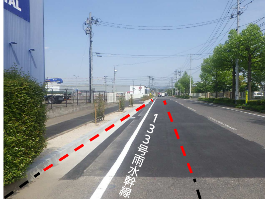
歩車道境界ブロック・植栽復旧完了 (上流側から下流側を望む)