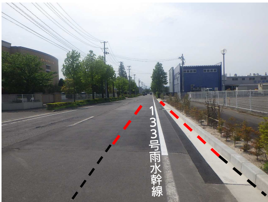
歩車道境界ブロック・植栽復旧完了 (下流側から上流側を望む)