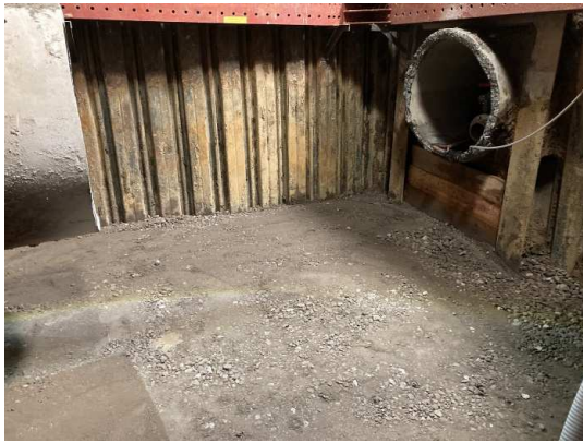
組立マンホール基礎砕石完了

5月は、組立マンホール設置、覆工板設置などを行いました。 6月は、引き続き、市道部分のボックスカルバート布設などを行います。