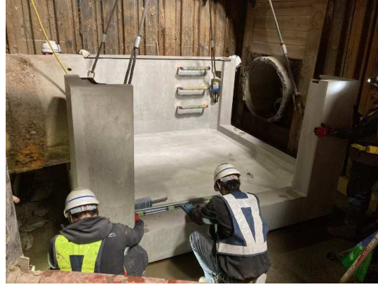
組立マンホール設置状況