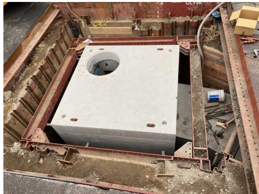
組立マンホール設置完了