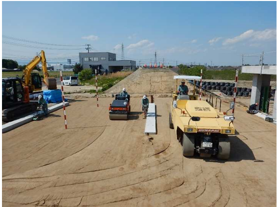
樋門埋め戻し状況