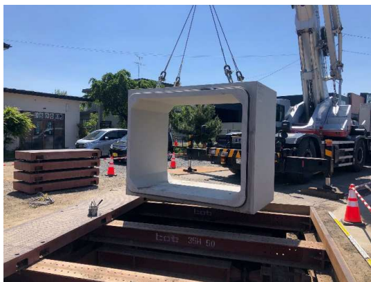
ボックスカルバート設置状況

5月は、特殊人孔設置、ボックスカルバート設置などを行いました。 6月は、引き続き、埋め戻し及び舗装復旧などを行います。