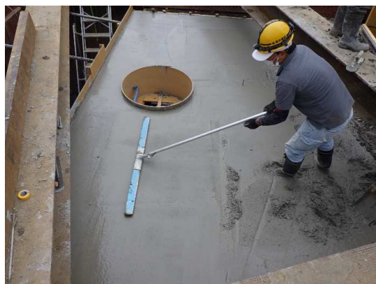
特殊人孔コンクリート打設状況