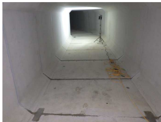
ボックスカルバート設置完了