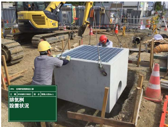
排気柵設置状況 (特殊人孔No.1)