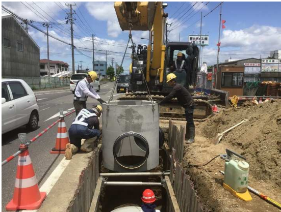
雨水切り回し設置状況 (特殊人孔No.1)

5月は、発進立坑・到達立坑の特殊人孔の築造を行いました。 6月は、引き続き、到達立坑の特殊人孔・排水管等の築造などを行います。