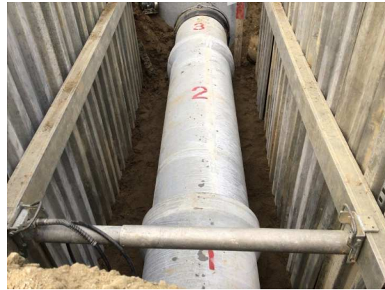
雨水切り回し設置状況 (特殊人孔No.1)