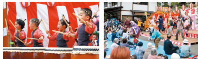
どんどんっ!一生懸命太鼓を演奏 各々が独自のひょっとこ踊りを披露

西田保育園児によるさくら太鼓を皮切りに、七福神踊りなどが披露されました。観客が飛び入り参加した芸芸大会では、ユーモアあふれるひょっとこ踊りで、会場は笑顔と拍手に包まれました。