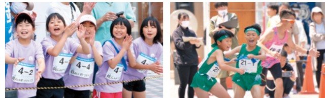
仲間の力走に応援も力が入ります 「あとは頼んだ!」「任せろっ!」

思わず足を止めて拍手を送る買物客も多く、たすきをつないでゴールを目指す子どもたちへの大きな声援が、まちなかに響いていました。