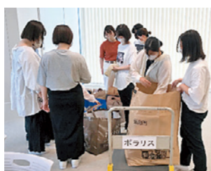
古着を袋に詰めて、困っている子どもたちにワクチンを届けるぞ！