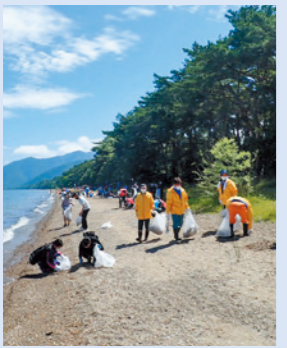
毎年さまざまな湖岸清掃活動に参加しています。

キャンペーンイベントを開きました。参加者には焚き火で出た炭を残さず持ち帰ってもらい、持参してもらった食器に食べ物などを振る舞いました。すると参加者からは、「ごみがないと景色ももつときれいに見えて気持ちがいいね」「使い捨ての容器代もかからないし、これからはキャンプのときは食器を持っていくのかな」などの声をもらい、企画は大成。今年も開催したいと思っています。