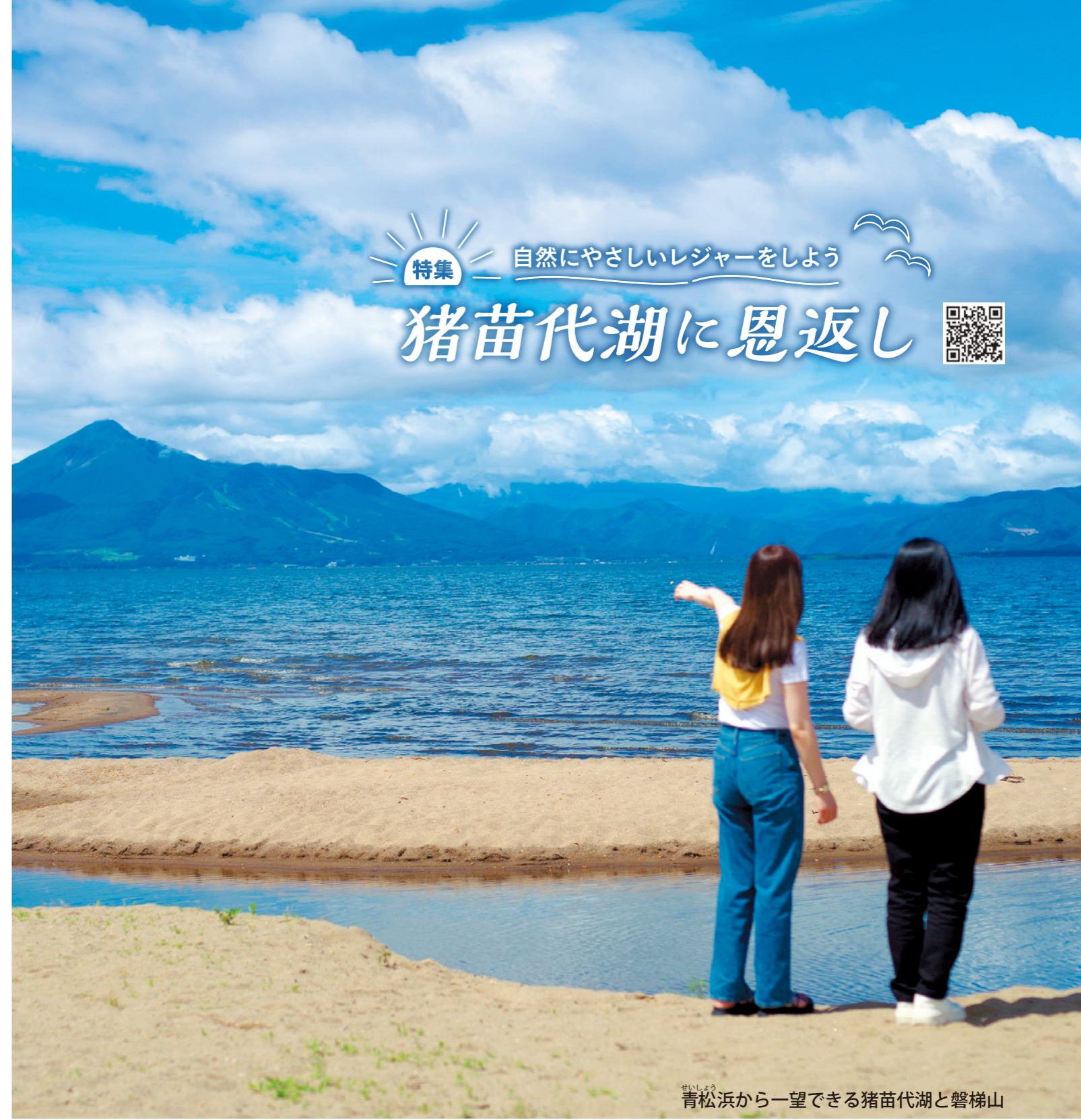
青松浜から一望できる猪苗代湖と磐梯山