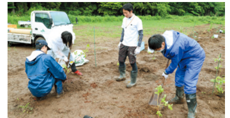
日大生たちとゼロから始める農園づくり!

猪苗代湖には眠っている観光資源がまだまだあります。今後も猪苗代湖やその周辺地域が未来まで愛されるように、猪苗代湖の魅力と可能性を発信し、盛り上げていきたいです。