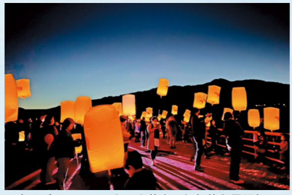
夜はパルーンランタンや花火で幻想的な雰囲気に