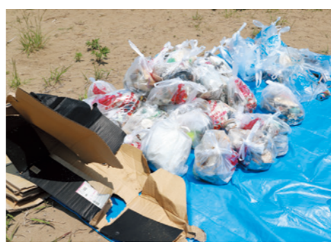
段ボールや瓶・缶など、レジャーなどで出たと思われるごみが大量に集まりました。

上下水道局では5月27日に、一斉ごみ拾い活動である水源地清掃プロジェクトを開催。湖南町館浜を中心にボランティア参加者が湖岸を散策すると、プラスチック製品や炭化した木片などが大量に発見され、一時間でおよそ20kgのごみが集まりました。