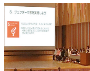
複数のゴールに対する取り組みを、報告会で発表しました。