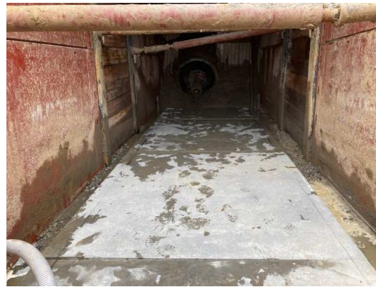
土留め・基礎版設置完了