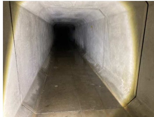
ボックスカルバート内部状況